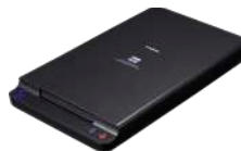
Položena jedinica za A4 skeniranje 102