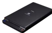
Položena jedinica za A4 skeniranje 102

Posetite Canon veb stranicu za više informacija.